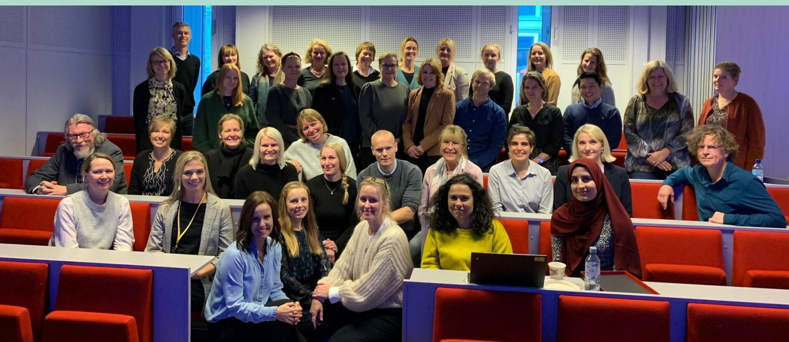
Deltakere ved nettverkssamlingen 2021, OsloMet

På twitter finner du oss her . Tagg oss gjerne dersom du f.eks. publiserer artikler, kronikker e.l. eller deltar på konferanser som omhandler helsekompetanse.